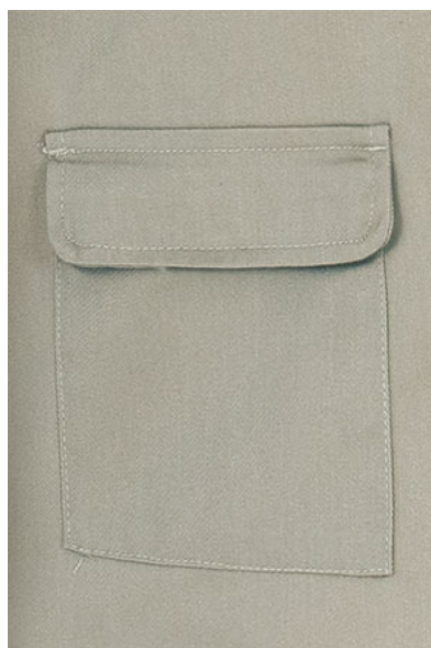
Detalle bolsillo inferior trasero con tapa