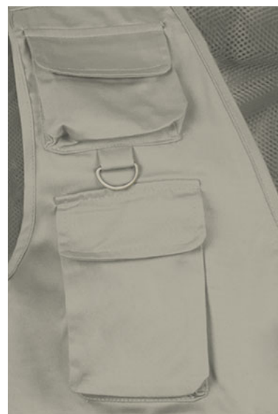
Detalle bolsillos y anilla en pecho superior derecho