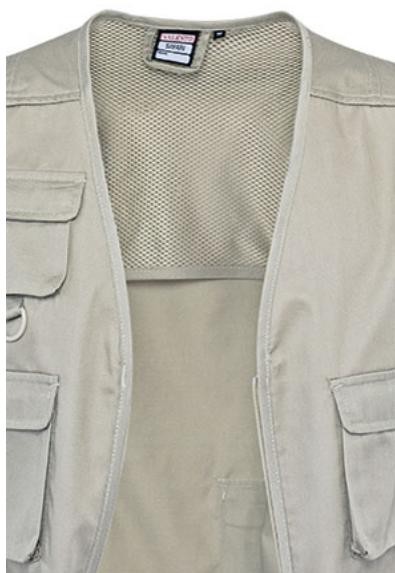
Detalle rejilla interior en espalda (en zona superior)