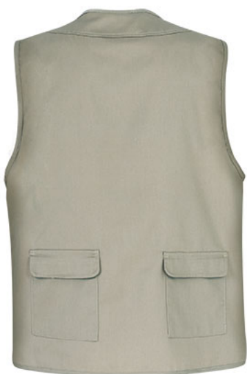
Vista parte trasera de la prenda (espalda)