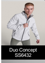
Duo Concept SS6432