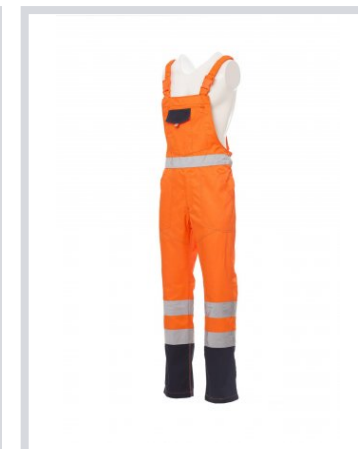
NARANJA FLUORESC ENTE/AZUL MARINO