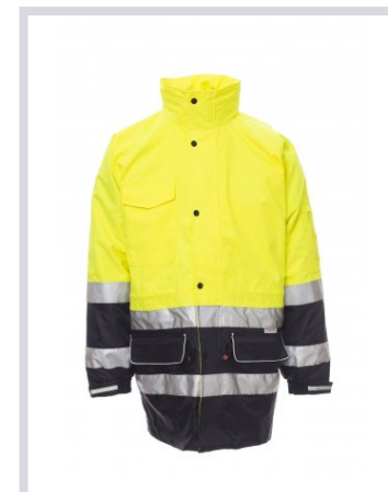
AMARILLO FLUORESC CENTE/AZUL MARINO