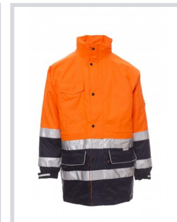
NARANJA FLUORESC ENTE/AZUL MARINO