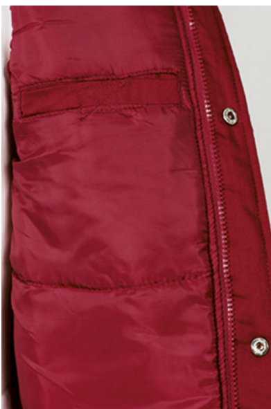
Detalle bolsillo interior en pecho izquierdo