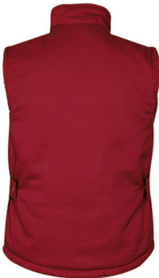
Vista parte trasera de la prenda (espalda)