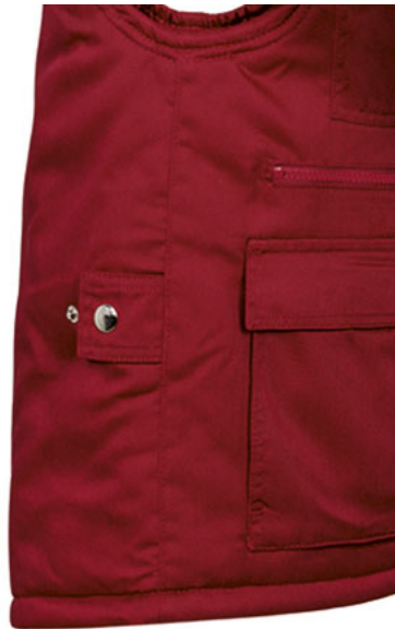
Vista lateral: espalda más larga