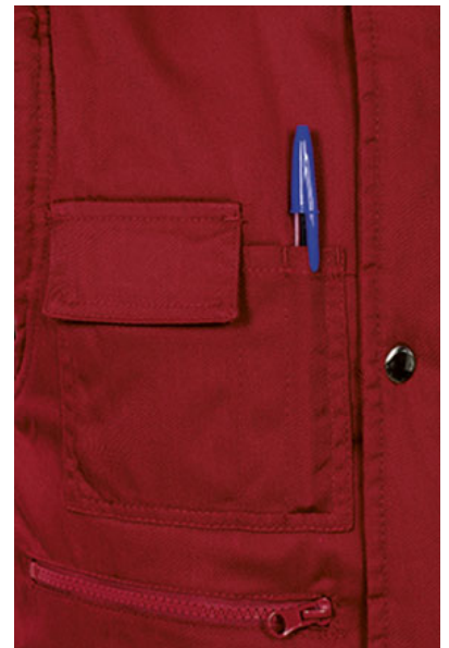
Detalle bolsillo en pecho derecho