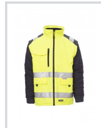
AMARILLO FLUORESC CENTE/AZUL MARINO