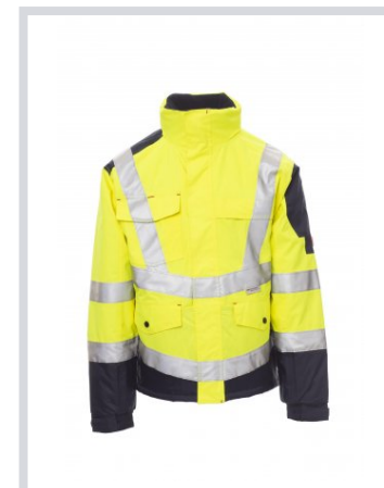
AMARILLO FLUORES CENTE/AZUL MARINO