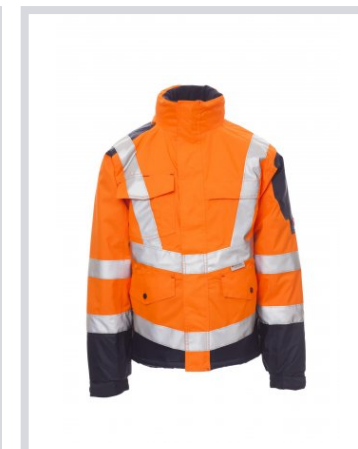
NARANJA FLUORESC ENTE/AZUL MARINO