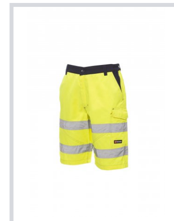
AMARILLO FLUORES CENTE/AZUL MARINO