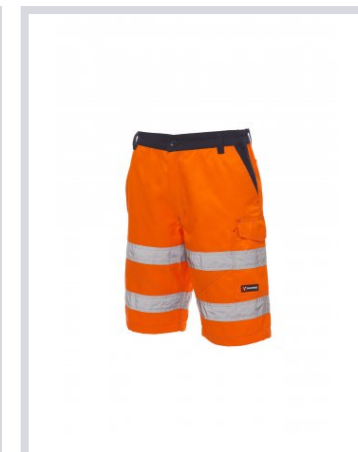
NARANJA FLUORESC ENTE/AZUL MARINO