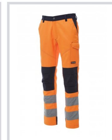
NARANJA FLUORESC ENTE/AZUL MARINO