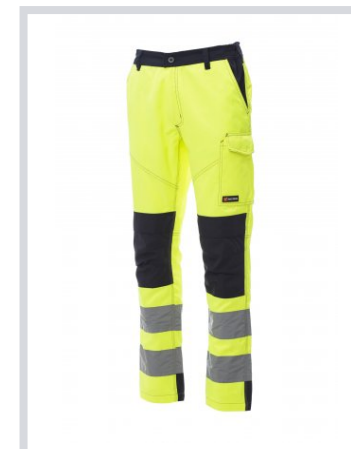
AMARILLO FLUORESC CENTE/AZUL MARINO