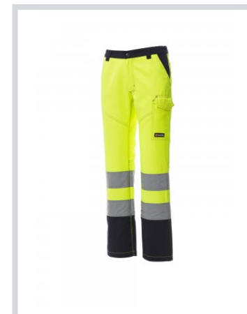
AMARILLO FLUORES CENTE/AZUL MARINO