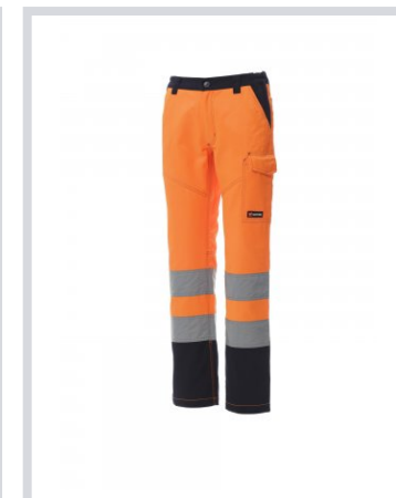
NARANJA FLUORESC ENTE/AZUL MARINO