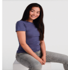
Duo Concept CA6627