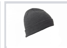
GRIS CENIZA MELANGE